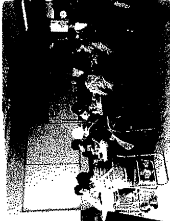
仲間とのおしゃべりも楽しそう

『利用者さんがお弁当を楽しみに待っていてくれることが嬉しい』と話してくれました。