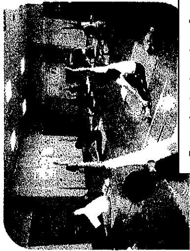
『ママリフレッシュ』 子育て中のお母さんのヨガ (保育付)