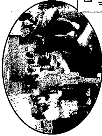
『みんなでチャレンジ』 小学生のお菓子作り