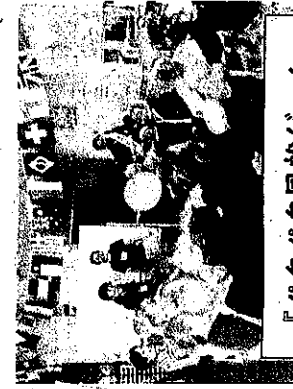
『パタパタ風船ゲーム』にも熱が入ります

10月18日・19日の2日間、デイサービスでは毎年恒例の秋の運動会を開催しました。玉入れやパン食い競争などの競技で“運動の秋”を楽しみました！