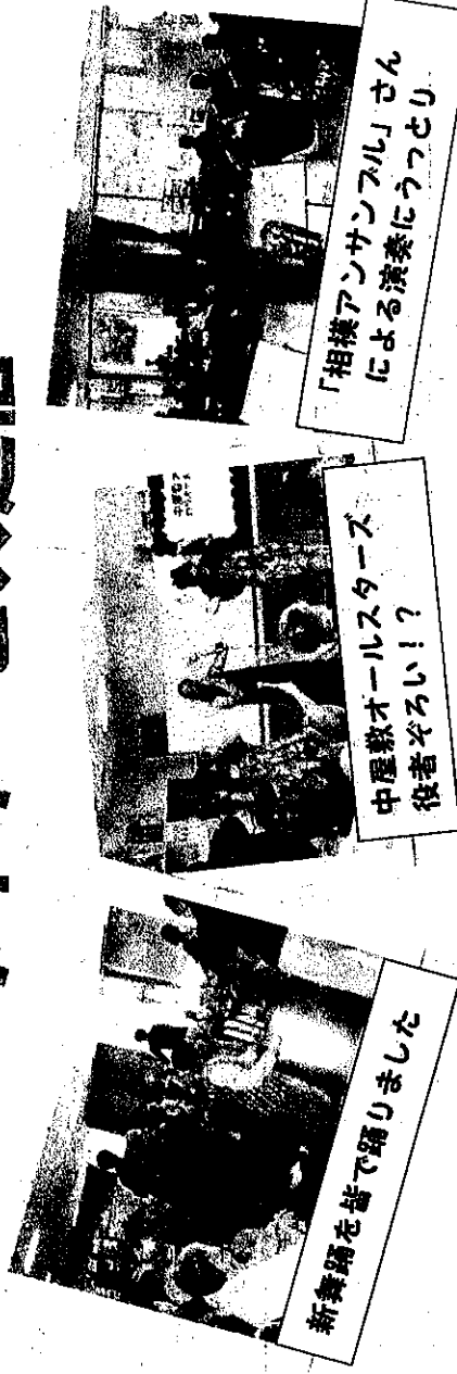
中屋敷オールスターズ 役者ぞろい！？