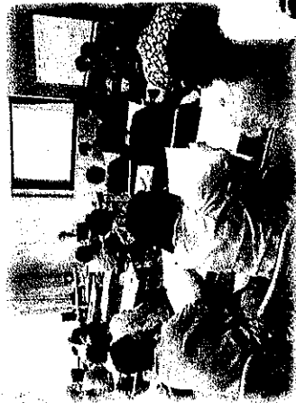
熱心に耳を傾ける受講者

9月15日・10月26日の2回で『若い仕度講座』を開催しました。参加者は1回40名前後。内容は認知症にならないための生活習慣や、講師自身の介護体験をもとに語り、参加者は深くうなずいたり、熱心にメモを取るなど講師の話に引き込まれていた様子が見られました。